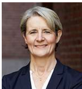
Charlotte Arup Group CHRO sedan 2017.

Eget och närståendes innehav: 576 396 aktier.