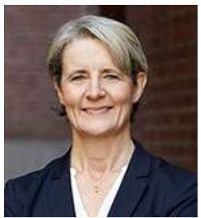
Charlotte Arup Group CHRO sedan 2017.

Eget och närståendes innehav: 576 396 aktier.